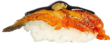
Anguila y Foie Flambeado con salsa teriyaki. 3,20 € 🐟🍷🌿🥣