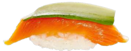
Salmón & Aguacate 🐟 2,20 €