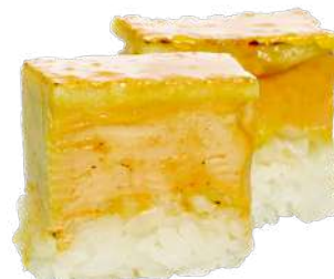
Oshi Sushi Foie gras micuit con manzana y finca capa de caramelo de oro (2/4 piezas). 4,50 € / 8,00 €