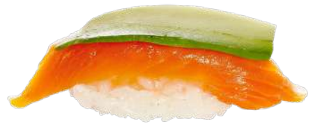
Salmón & Aguacate 🐟 2,20 €