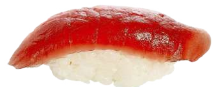
Atún Rojo 🐟 2,80 €