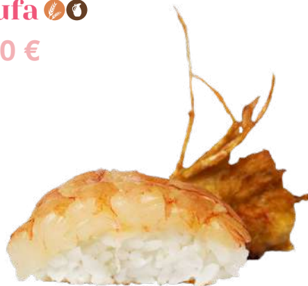
Gambón Salvaje 🦞🌿 2,20 €