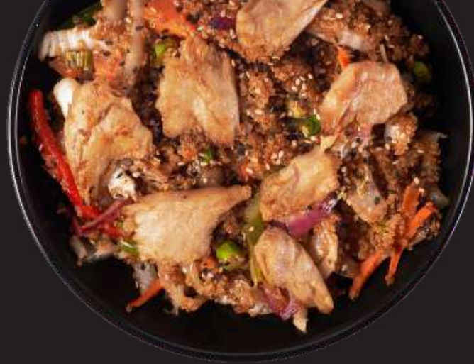
Wok 100% Vegetal