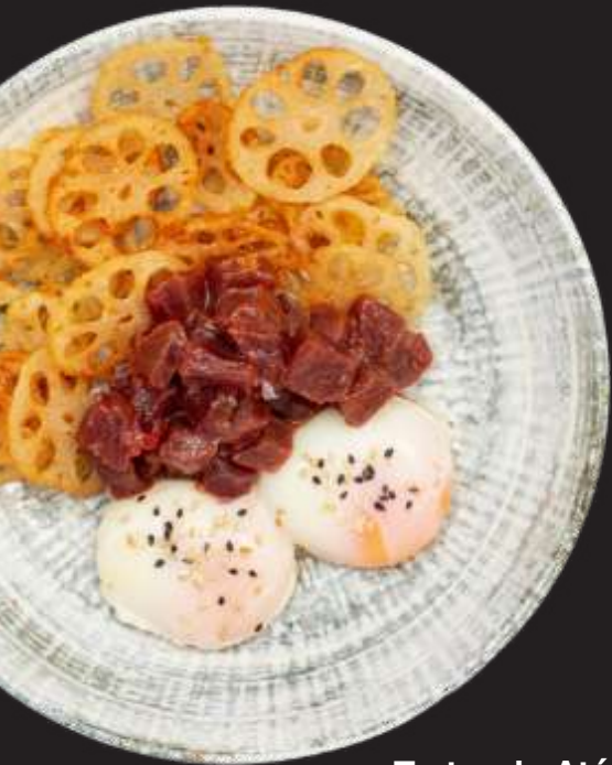
Tartar de Atún Rojo con Huevos y crujiente de Loto

Es una proteína vegetal que ofrece la experiencia de la carne con todos los beneficios de los vegetales.