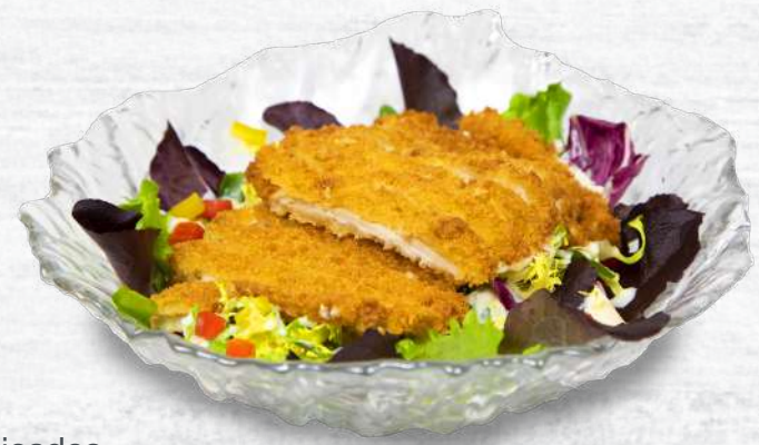
Ensalada de Pollo Katsu