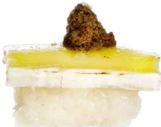
Brie flambeado con Trufa 🍷🍄🥚 2,50 €