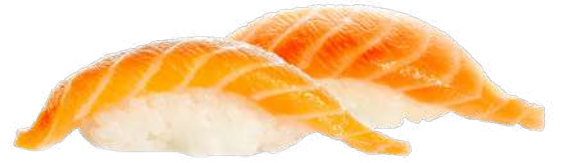
Salmón Noruego 🐟 2,00 €