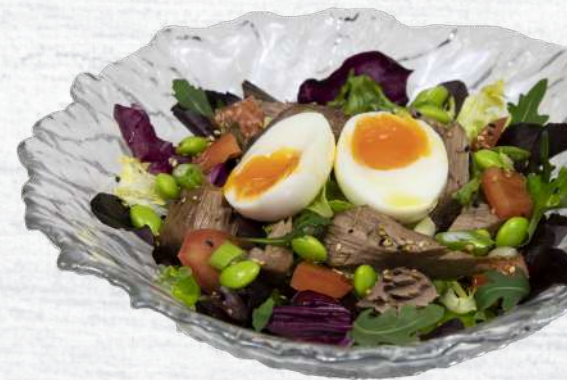
Ensalada de Atún Rojo de Almadraba confitado