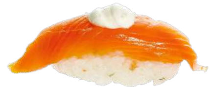
Salmón & Queso Cremoso 🐟🧀 2,20 €