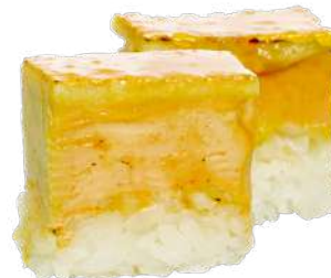
Oshi Sushi Foie gras micuit con manzana y finca capa de caramelo de oro (2/4 piezas). 4,50 € / 8,00 €