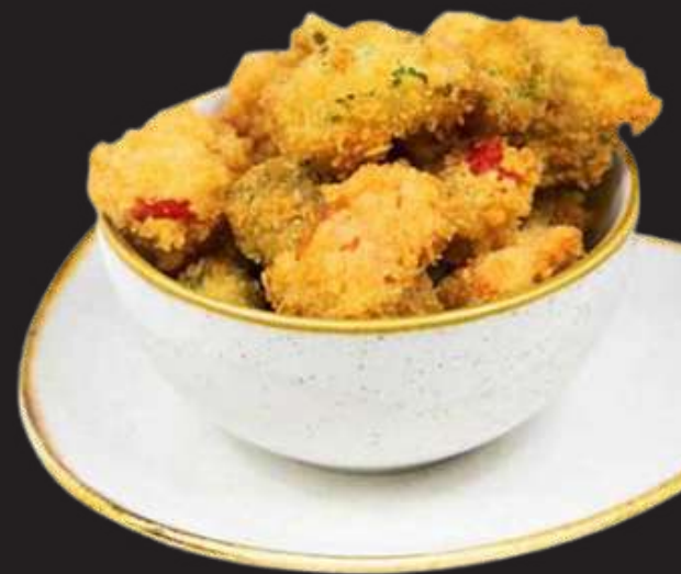
Tempura de Verduras Panko