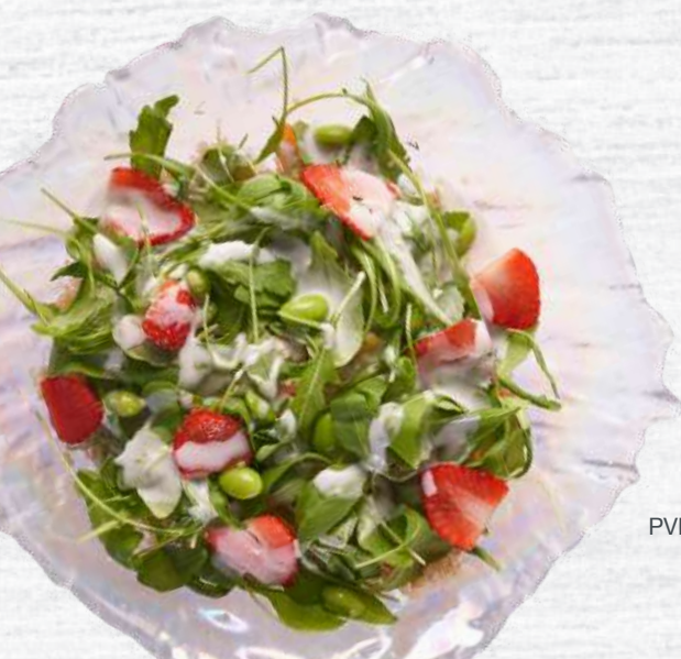
Ensalada tropical de quinoa