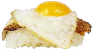
Huevo de Codorniz y Anguila 🍳🐟🍷🌿 3,00 €