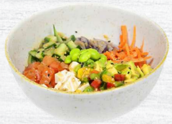
Poke 100% Vegetal