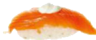
Salmón & Queso Cremoso 🐟🧀 2,20 €