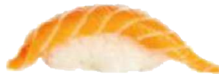
Salmón Noruego 🐟 2,00 €