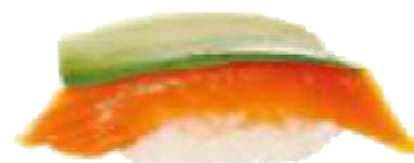
Salmón & Aguacate 🐟 2,20 €