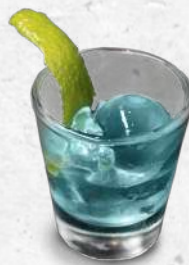
Spheric Cocktails Vodka y frambuesa 1,80€