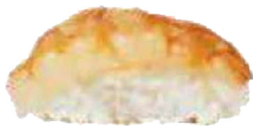
Gambón Salvaje 🦞🌿 2,20 €