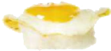
Huevo de Codorniz con trufa 🍳🍄 2,70 €