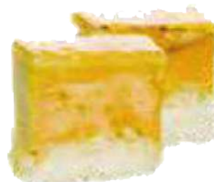
Oshi Sushi Foie gras micuit con manzana y finca capa de caramelo de oro (2/4 piezas). 4,50 € / 8,00 €