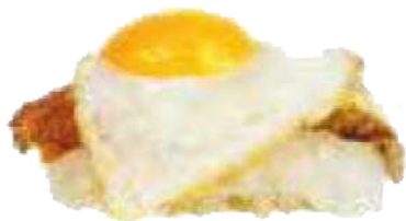
Huevo de Codorniz y Anguila 🍳🐟🍷🌿 3,00 €