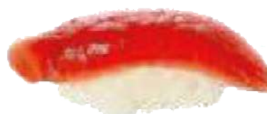
Atún Rojo 🐟 2,80 €