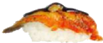
Anguila y Foie Flambeado con salsa teriyaki. 3,20 €