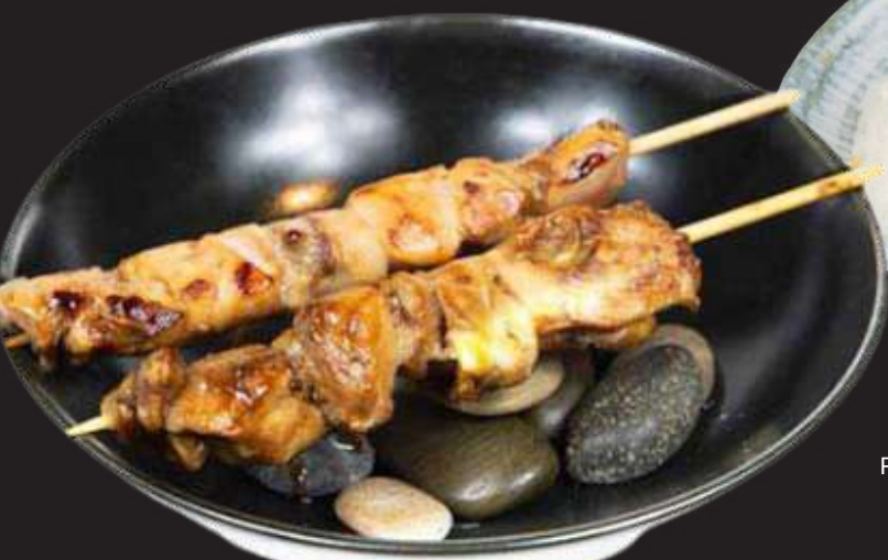
Yakitori de Pollo de Corral