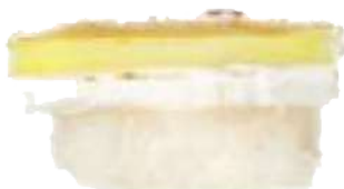
Brie flambeado con Trufa 🍷🍄 2,50 €