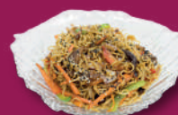
Yakisoba 100% vegetal