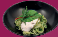
Noodles Frios de Pepino con Mayonesa Vegetal de Jengibre