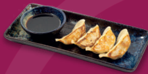
4 Gyozas de Carne