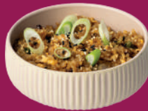
Miss Sensaciones de Pollo