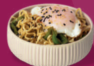
Yakisoba Vegetal con Huevo a Baja Temperatura

*A elegir entre: Agua | Refresco | Cerveza o vino