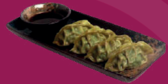
Gyozas de Kale