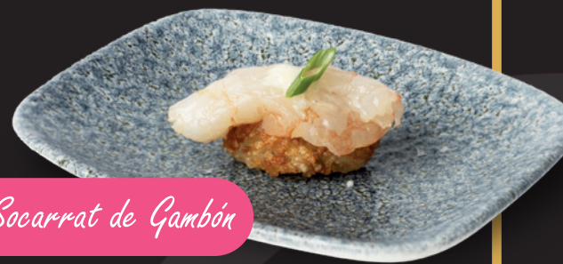
Nigiri de Socarrat de Gambón