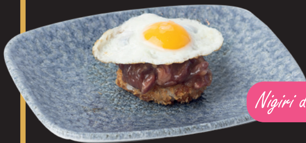
Nigiri de Tartar con Huevo