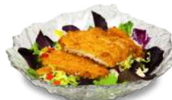
Ensalada de Pollo Katsu