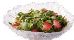
Ensalada de Quinoa