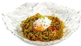
Yakisoba Vegetal con huevo