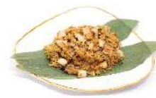
Sensaciones de pollo